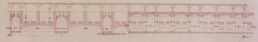
Fig. 3. nach 10 Fig. 4. nach 15 Fig. 5. nach 20