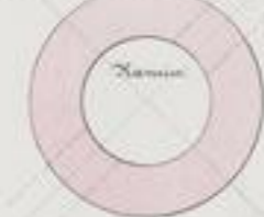
Fig. 1. Lageplan.

Der Kamin erhält die in Höhe und für einen belagten oben 1800 mm, für 2 Schmelzen 2200 mm hohe Weile