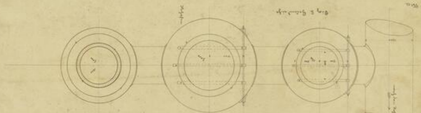
Sackrohren für das Abfließen der Schlacke sind die Heizapparate für die Schlacke.