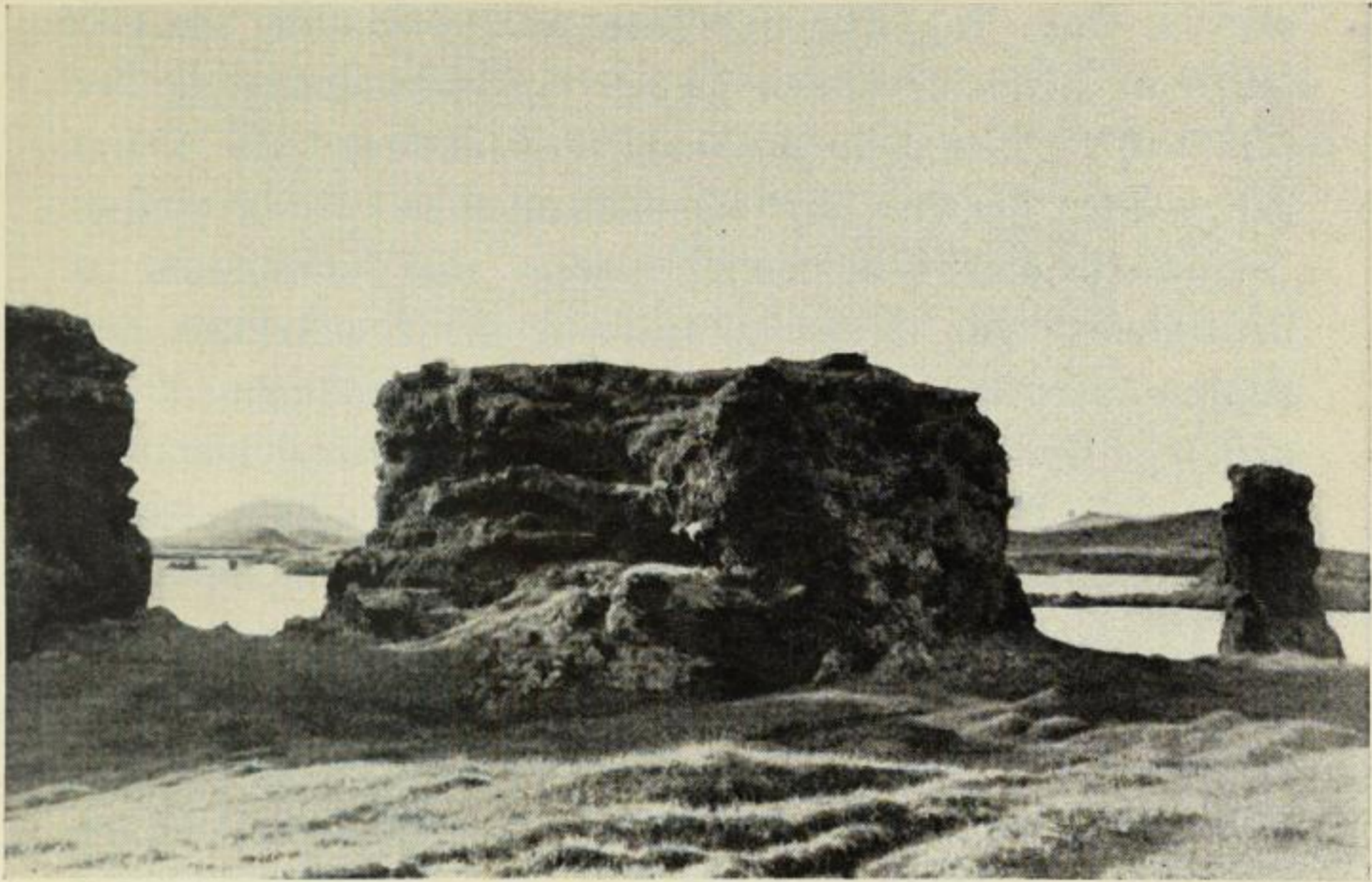
Ein eigenartig geformter Lavaberg