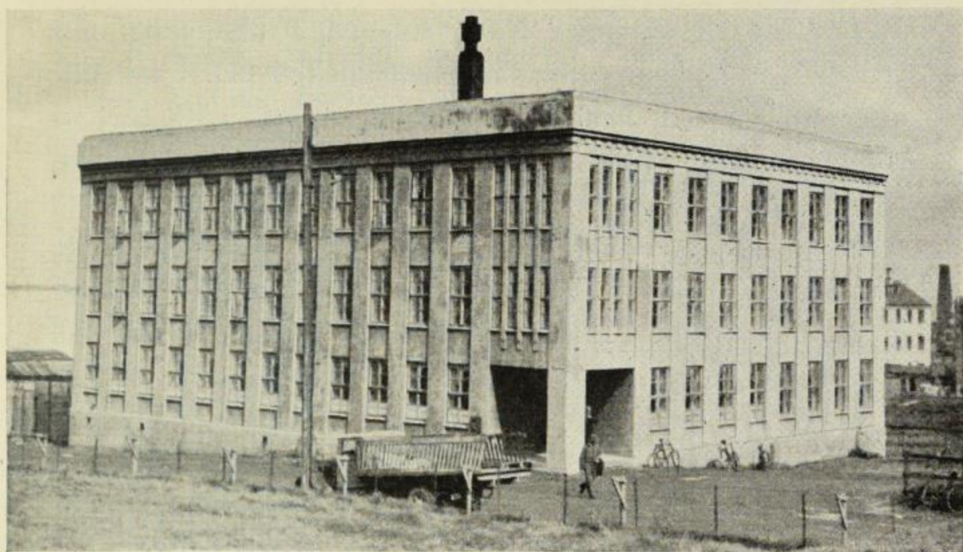
Reykjavik — Das neue Konsumvereinsgebäude