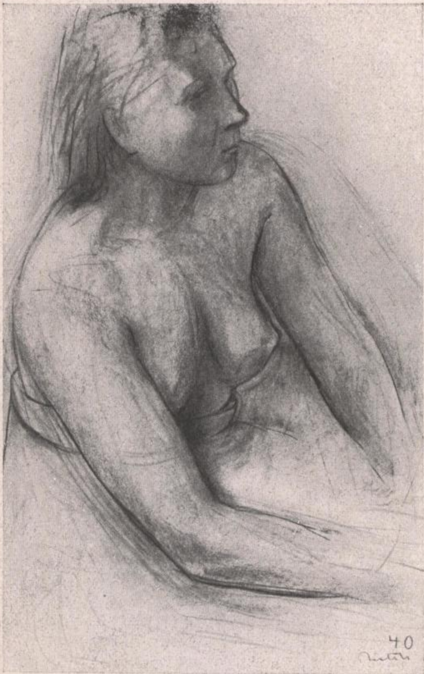
mädchen halbakt 1946