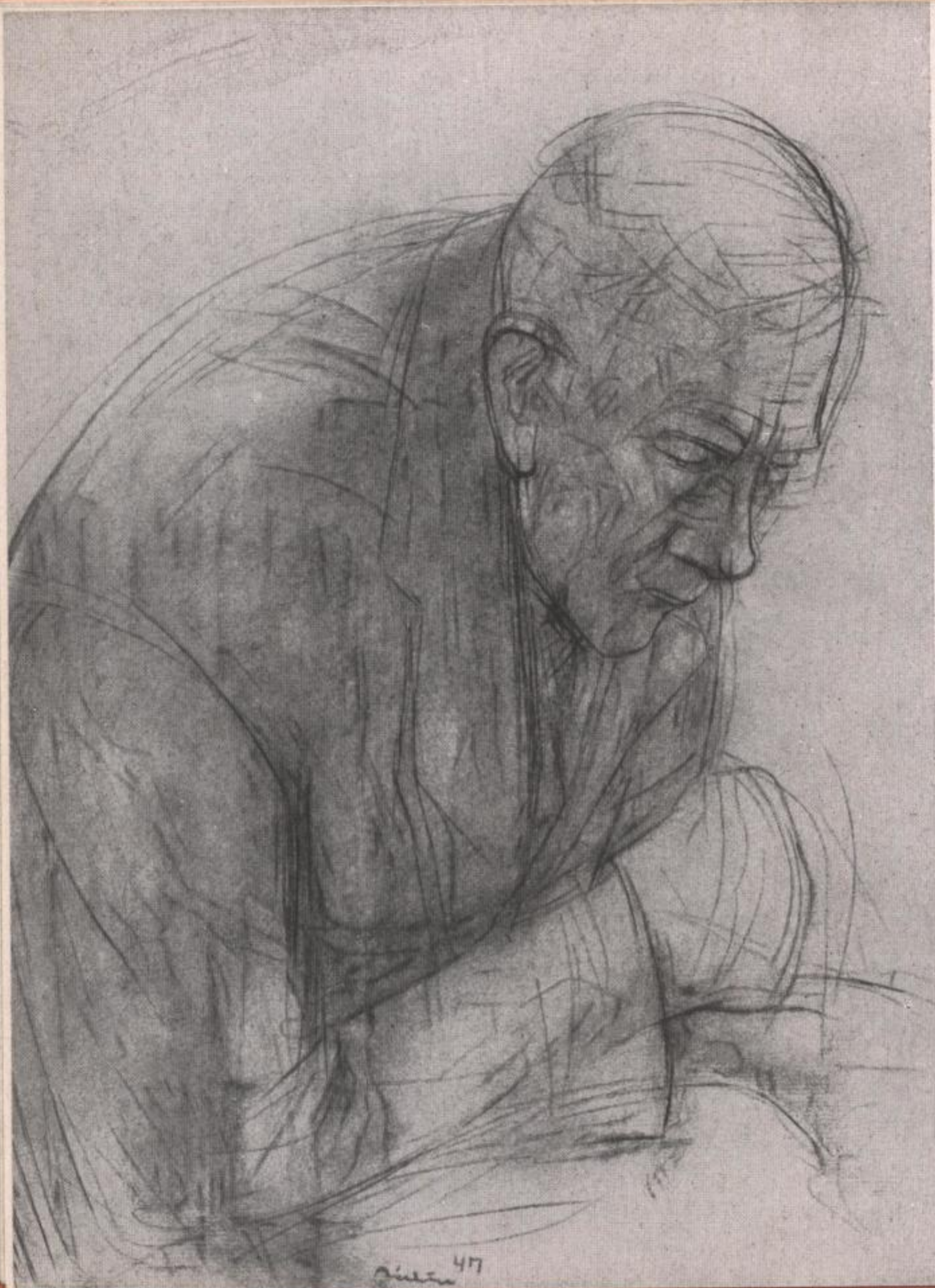
alter mann 1947