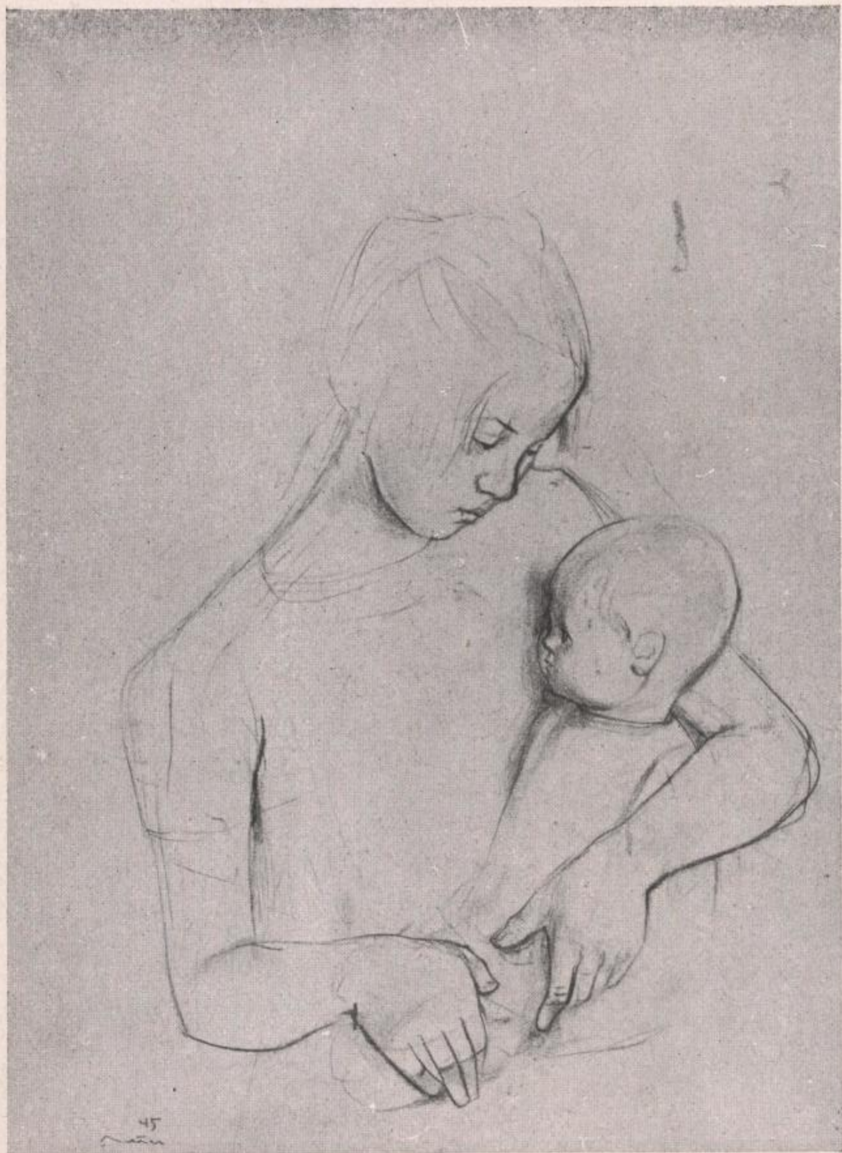
mädchen mit puppe 1945