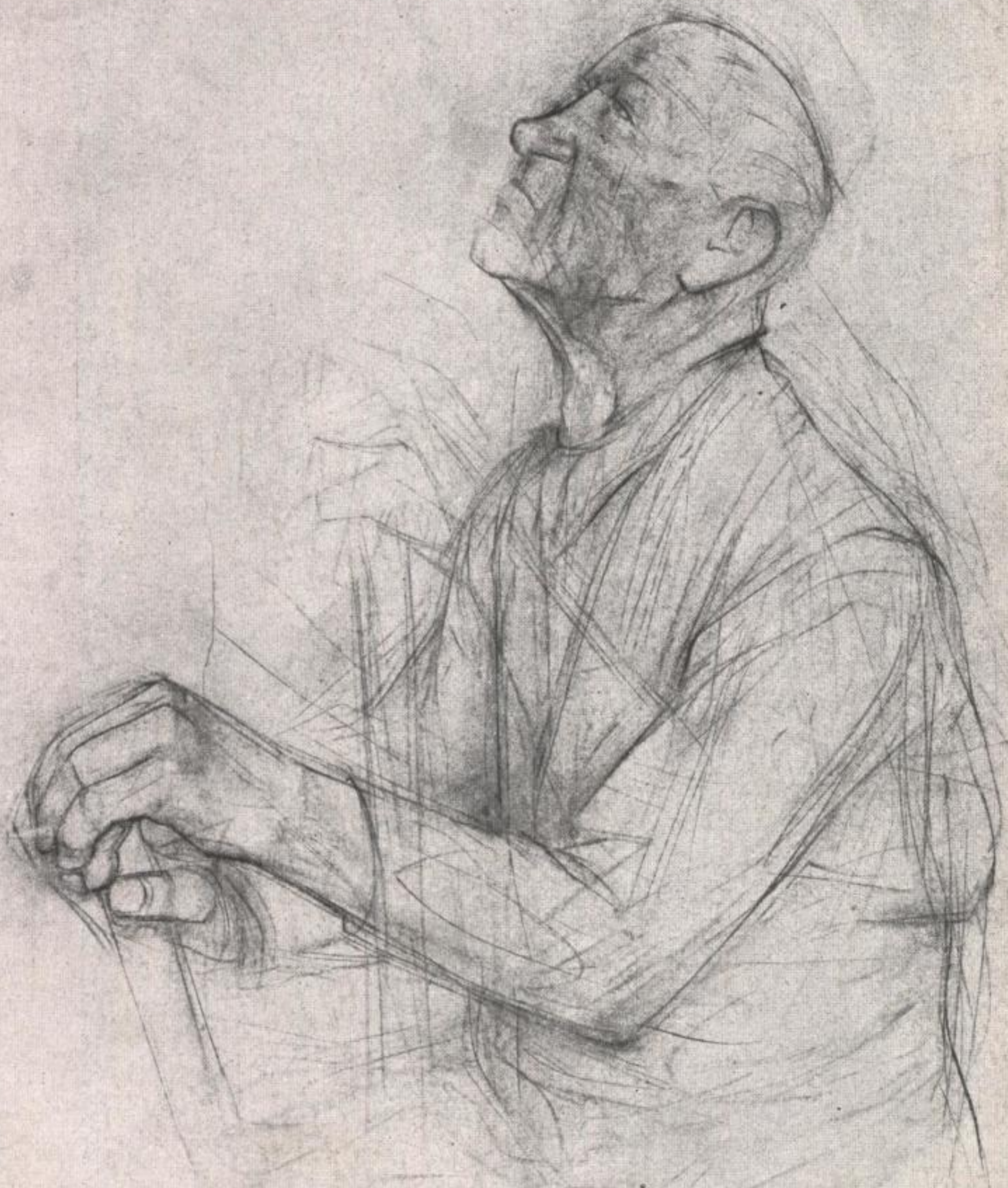
nach oben blickender alter mann 1947