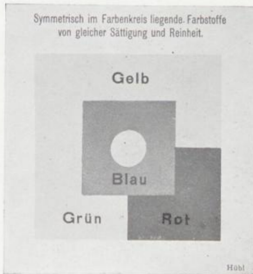
Rotes Teilbild (Aufnahme mit Blaugrünfilter)