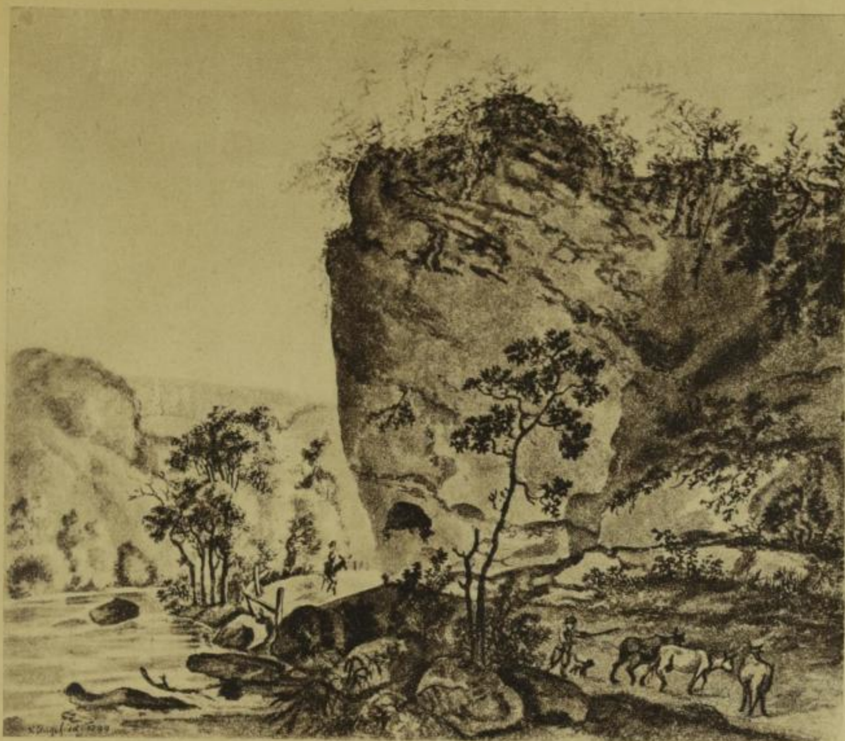
Der Backofenfelsen bei Hainsberg Ch. Klengel 1799 - Aus dem Privatbesitz von J. F. W. Wegener 1835