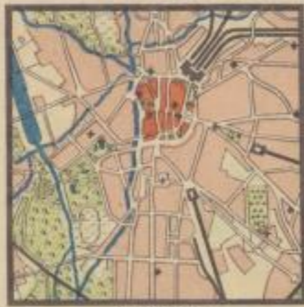
1: 100000 (1 cm Karte = 1 km Wirklichkeit)