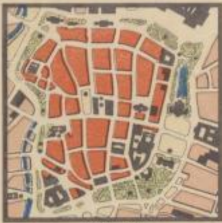
1: 25000 (4 cm Karte = 1 km Wirklichkeit)