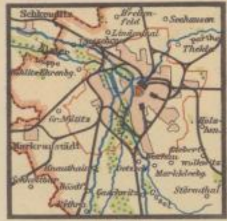
1: 500000 (2 mm Karte = 1 km Wirklichkeit)