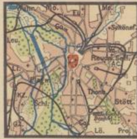
1: 200000 (1/2 cm Karte = 1 km Wirklichkeit)