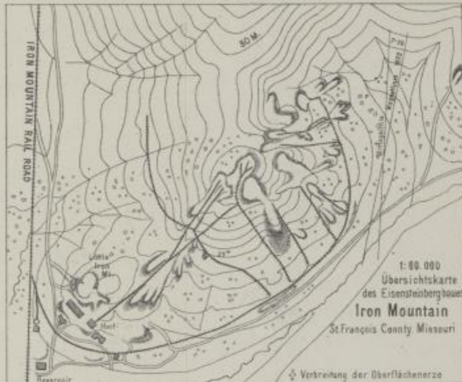
Ein Tagebau auf Iron Mountain