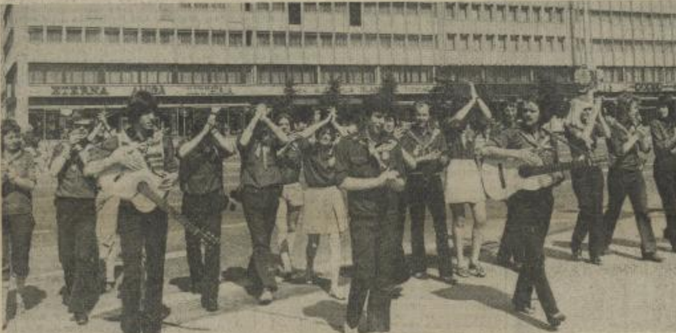
Zahlreiche Musik- und Gesangsgruppen wählten während der Tage des Festivals die Berliner und die vielen ausländischen Gäste zu begeistern. Zu ihnen gehörte auch der TH-Singklub, den unser Bild bei einem Gang über den Alexanderplatz zeigt.