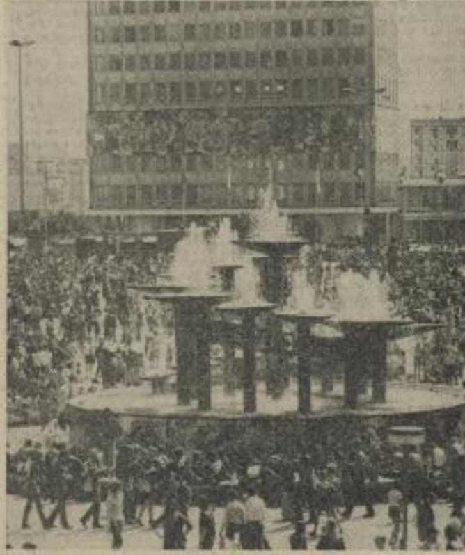
Zum Festival wurde der Alex zu einer riesigen Tribüne des politischen Meinungstreifes. Bis in den frühen Morgen wurde diskutiert.