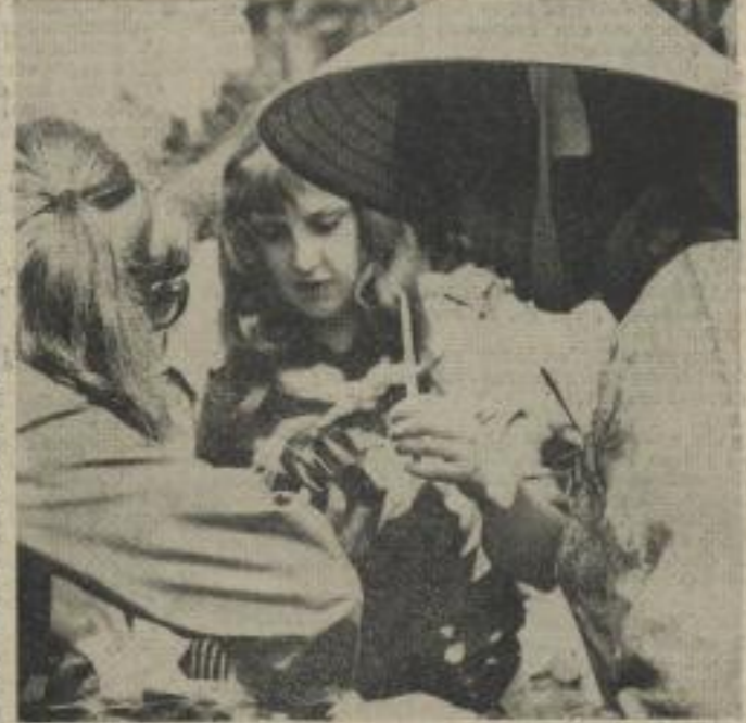
Immer wieder im Mittelpunkt herzlicher und freundschaftlicher Gespräche: die Jugend des heldenhafte Vietnam.