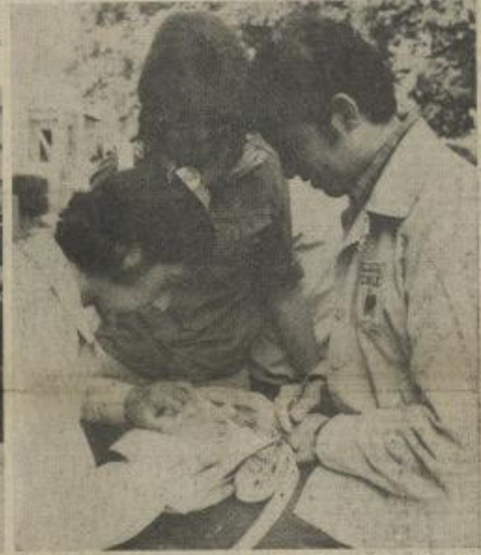
Der Austausch von Adressen war an der Tagesordnung; hier eine Freundin unseres Singklubs und zwei chilenische Delegierte.