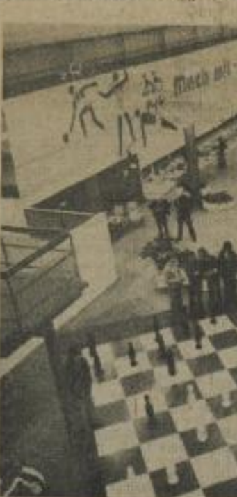
In den Schloßhallen öffnete kürzlich ein Freizeitzentrum für die Jugend unserer Stadt seine Pforten.

Der Bezirk Karl-Marx-Stadt ist mit über 100 jungen Sportlern vertreten und wird in allen drei Disziplinen an Start sein.