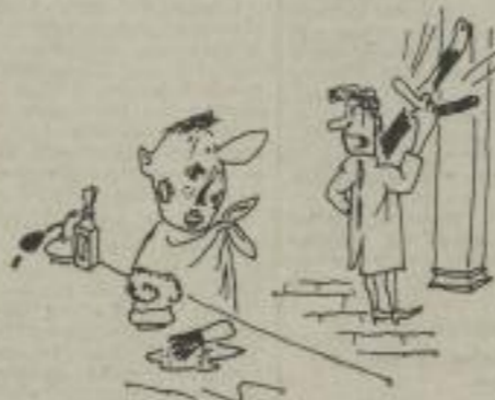
Sie sind wohl noch Lehrlinge? Ich habe heute bloß schlechte Laune!

„Immer muß ich alles alleine machen“, sagte der Individualist zornig, „sogar euer Kollektiv kritisieren.“ Er nimmt sich alle Kritik sehr zu Herzen. Was aber nützt es ihm, wenn er seine chronischen Herbeschwärden standhaft erträgt? Manches schlummernde Talent sollte man in unser aller Interesse früh weisenschlafen lassen. (Von Gerd W. Heyse)