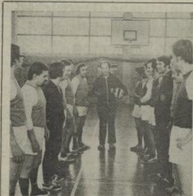
Mit 2:0 trennte sich nach hartem Kampf FPM I (rechts) als Sieger im Hallenfußballturnier von FPM II.