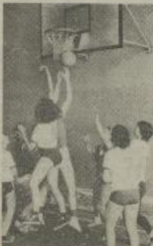
Spielszenen aus dem Spiel Motor Lauchhammer gegen TH Karl-Marx-Stadt.