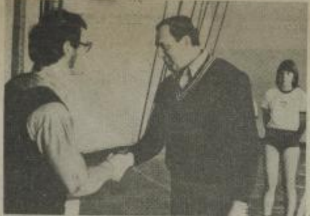
Vor dem Basketballturnier wurden verdienstvolle Spieler und Funktionäre...