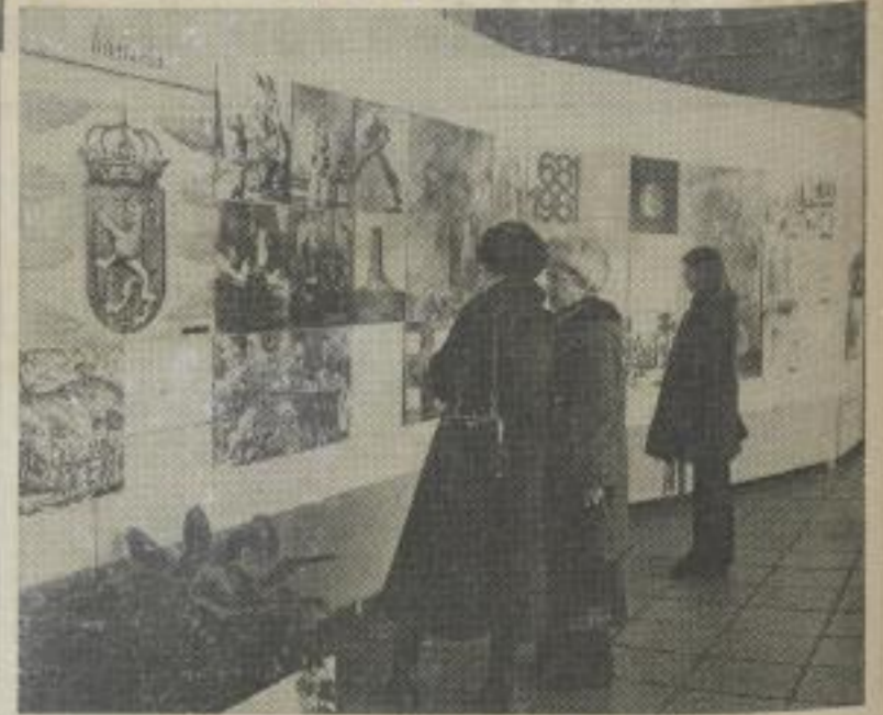
Diese Ausstellung war im Dezember im Foyer des neuen Sektionsgebäudes zu sehen.