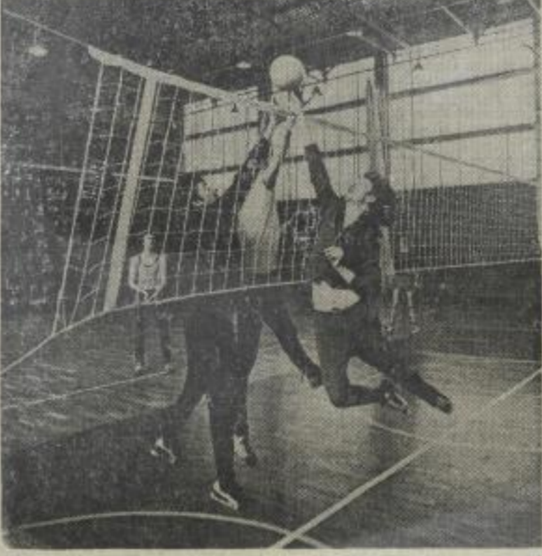
Mit der neuerbauten Turnhalle verfügt unsere Hochschule über wesentlich bessere Voraussetzungen, die Aufgaben im Studentensport zu erfüllen, und darüber hinaus wurden auch den Sportlern der Hochschulsportgemeinschaft bessere Trainingsmöglichkeiten geschaffen.

Die Prüfungen (Zwischen-, Abschluß- und Hauptprüfungen) werden auf der Grundlage der Prüfungsordnung des Ministeriums für Hoch- und Fachschulwesen vom 3. Januar 1973 in Übereinstimmung mit den verbindlichen Studienplänen durchgeführt. Prüfungsart, -form, -termin, -raum und prüfende Hochschullehrer sind aus dem Prüfungsplan ersichtlich. Die Prüfungsabschnitte liegen am Ende der Vorlesungszeit und umfassen im Herbstsemester eine Woche, im Frühjahrsemester