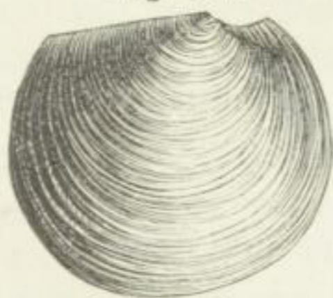
Lucina proavia Goldf. Eiflerkalk (Mitteldevon).

auch die ersteren verkümmert. Vorderer Muskeleindruck lang und schmal, hinterer oval. Recent und fossil von der Silurperiode an. Die für die recenten Formen aufgestellten Subgenera ( Cyclas Klein non Brug. , Myrtea Turton , Codakia Scopoli , Loripes Poli , Miltha H. a. A. Adams ) lassen sich auch zur Unterscheidung der zahlreichen, tertiären Arten verwenden. Für die palaeozoischen Formen hat J. HALL die Gattungen Paracyclas (Fig. 323) aufgestellt. (Devon, durch BARRANDE auch im böhmischen Ober-Silur nachgewiesen).