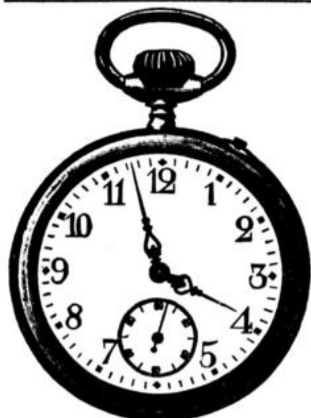
Goldene und silberne Remontoir- Damen- u. Herren-Uhren.

Während der Feiertage Kästner's humoristische Sänger.