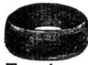
Trauringe, massiv Gold, gefeimelt, von 5-7 Mark.