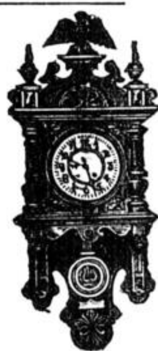
Zimmeruhren mit Dom-Gong.