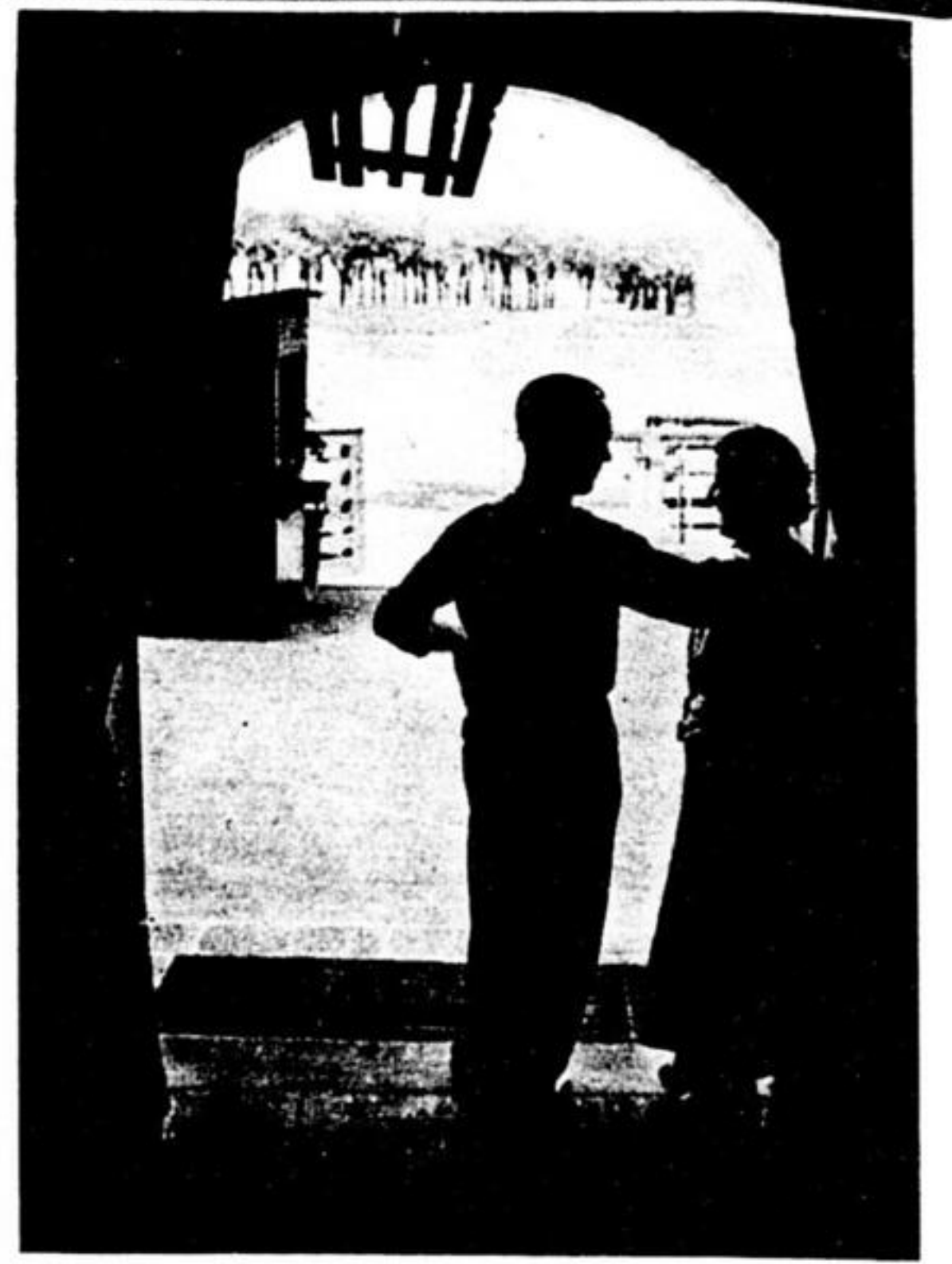
An diesem großen Faß ist das Spundloch der Eingang

Interessieren sich die Amerikaner dafür, die es sogar schon kaufen und über den Ozean transportieren wollten. So entwickelt sich allsummerlich im Faß und um das Faß herum ein buntes lustiges Treiben. Die Pfälzer behaupten, ein paar Tage im „Dürkheimer Faß“ seien besser als der längste Sanatoriumsaufenthalt, was auf einen Versuch ankäme. M. G.