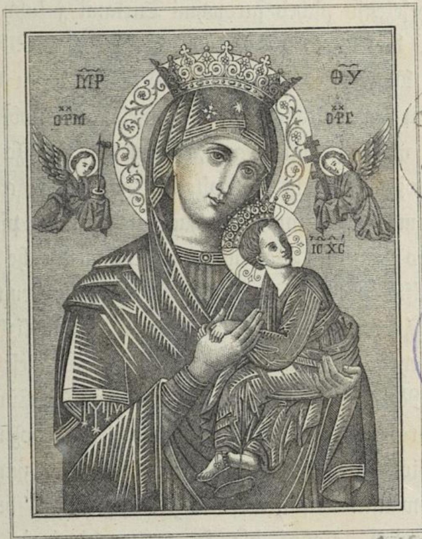
Lith. Anst. des J. Kravogl in Innsbruck.

„Schtóz mje namača, namača žiwjenjo a czěra spo- moženjo wot Knjeza.“ Pschisłowa Salom. 8, 35.