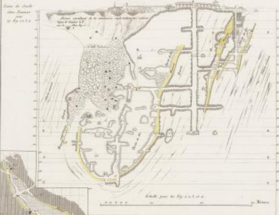
Fig. 2. 1 er et 2 e Plans relatifs à la Coupe Fig. 1.