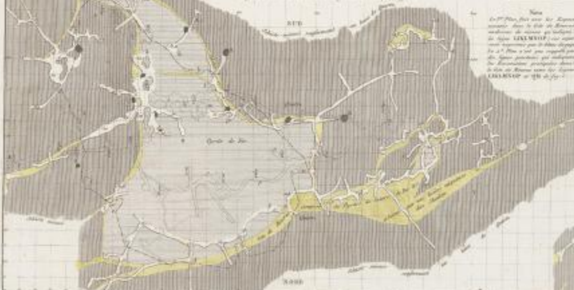
Fig. 2. 1 er et 2 e Plans relatifs à la Coupe Fig. 1.