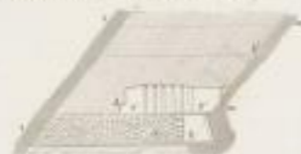
Fig. 2. Coupe verticale suivant AB de fig. 1 et CD de fig. 3.