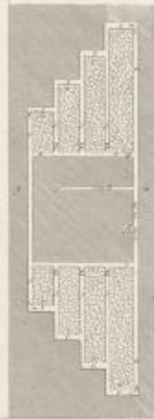
Fig. 3 Plan des travaux sur une coupe telle que PE de la fig. 2 et, suivant la fig. 4.