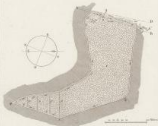
Fig. 1 Plan (vrais) des travaux de cette mine n. 2 de la coupe fig. 2.

Nota. Sur cette mine n. 2, on a commencé, on a creusé la grande fosse sous terre dans le 1.º précité et de plus tard il y a eu, la fosse n. 2, des travaux souterrains de grande étendue les fosses n. 3, 4, 5, 6, 7, 8, 9, 10, 11, 12, 13, 14, 15, 16, 17, 18, 19, 20, 21, 22, 23, 24, 25, 26, 27, 28, 29, 30, 31, 32, 33, 34, 35, 36, 37, 38, 39, 40, 41, 42, 43, 44, 45, 46, 47, 48, 49, 50, 51, 52, 53, 54, 55, 56, 57, 58, 59, 60, 61, 62, 63, 64, 65, 66, 67, 68, 69, 70, 71, 72, 73, 74, 75, 76, 77, 78, 79, 80, 81, 82, 83, 84, 85, 86, 87, 88, 89, 90, 91, 92, 93, 94, 95, 96, 97, 98, 99, 100.