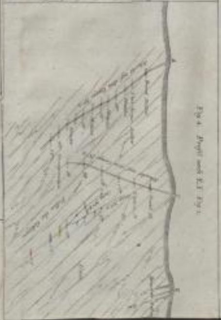
Fig. 4. Perspektiv nach E F der Fig. 1.