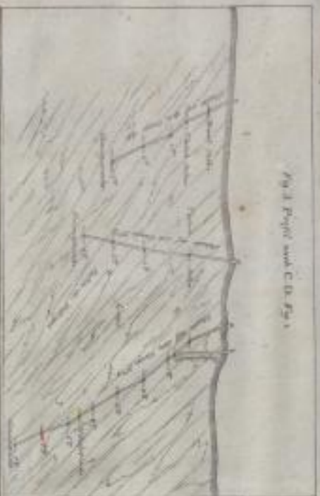
Fig. 3. Perspektiv nach C D der Fig. 1.