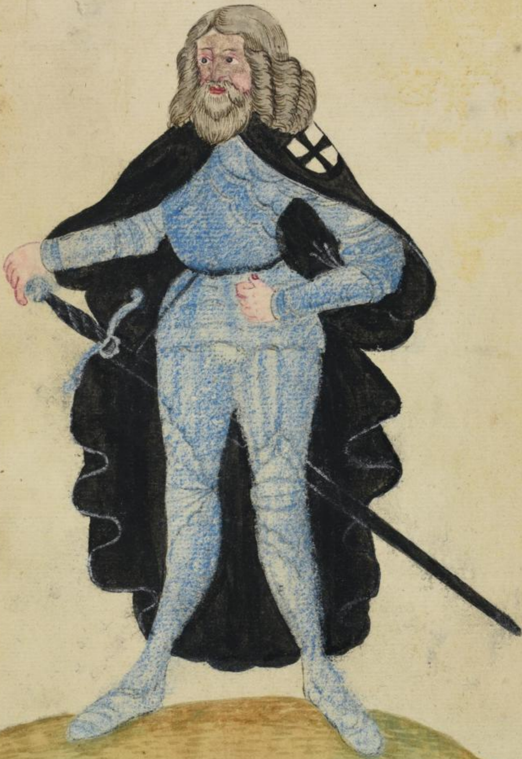
HEINRICUS adinu Teutonicoꝝ