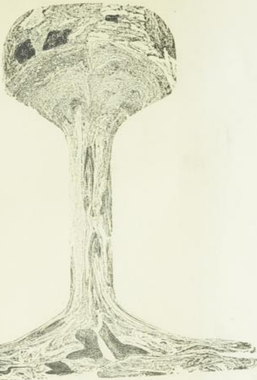
9a Zwischenbrücken 65 pfündig.