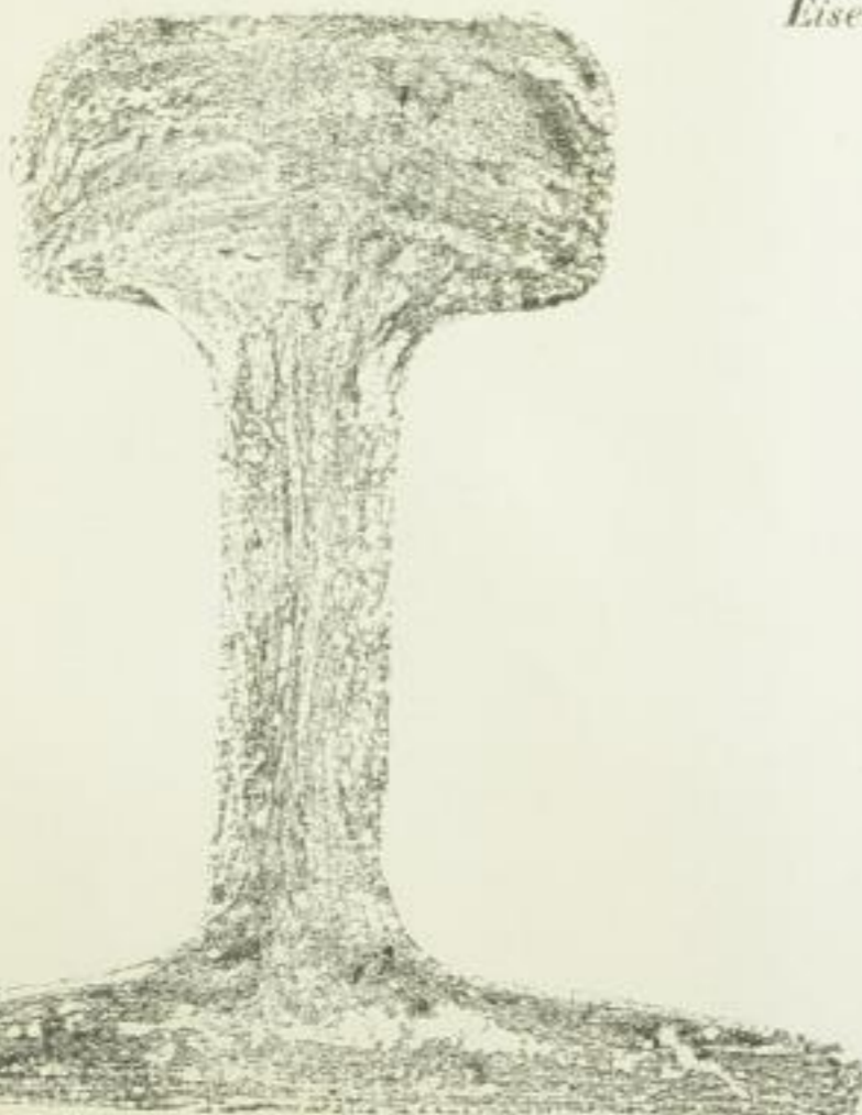
11. Özd. 61 pfündig.