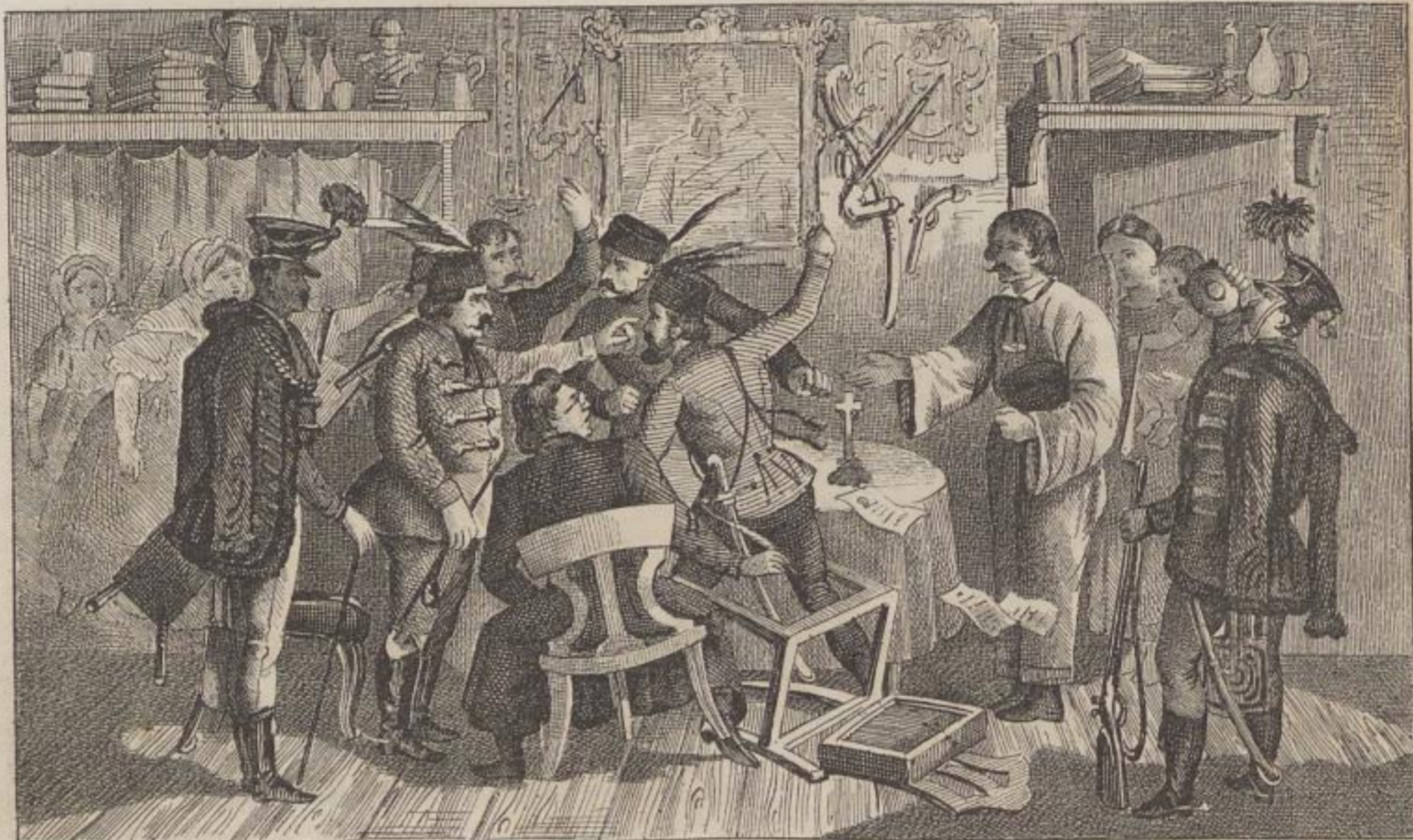
Antikresdes ungarisches Stuhlgericht.