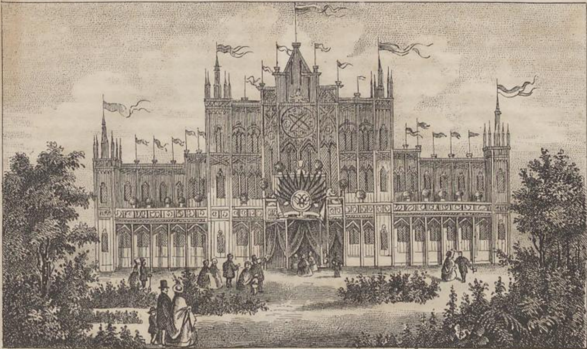
Die Festhalle des deutschen Sängersfestes in Nürnberg.