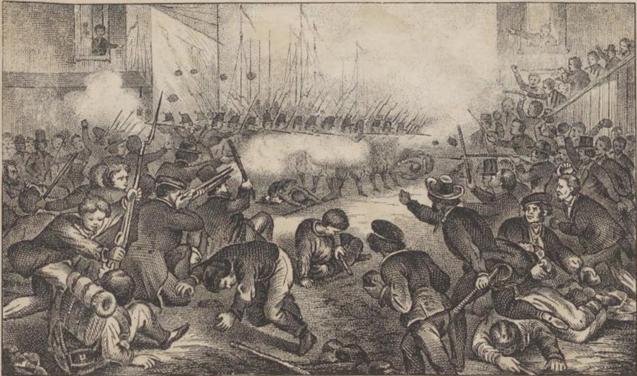
Zusammenstoß in Baltimore zwischen dem Pöbel und dem 6. Massachusetts-Regiment.