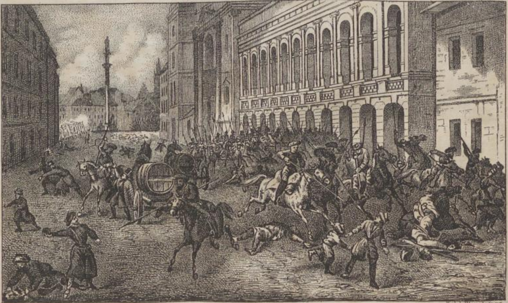
Plünderung der Krakauer Vorstadt in Warschau durch russische Truppen.