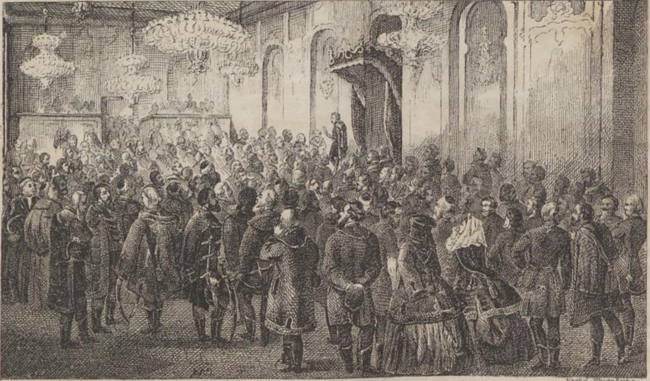
Die Eröffnung des ungarischen Landtags in Pest