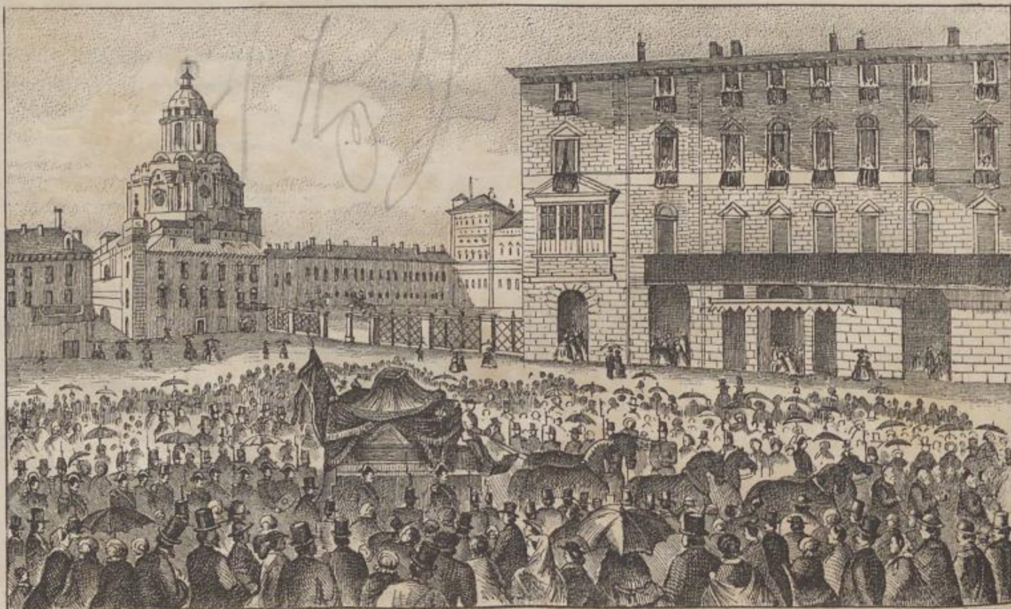
Das Leichenbegängniß Lavour's zu Turin.