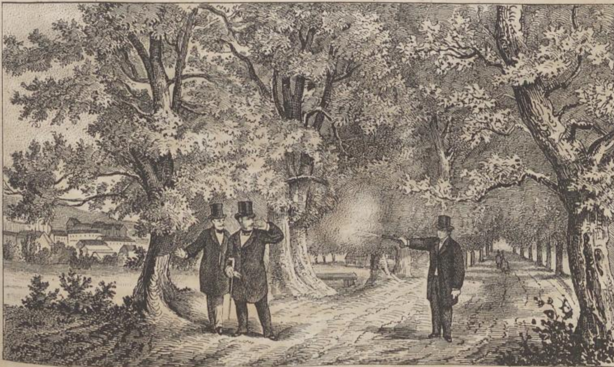
Das Attentat auf den König von Preußen.