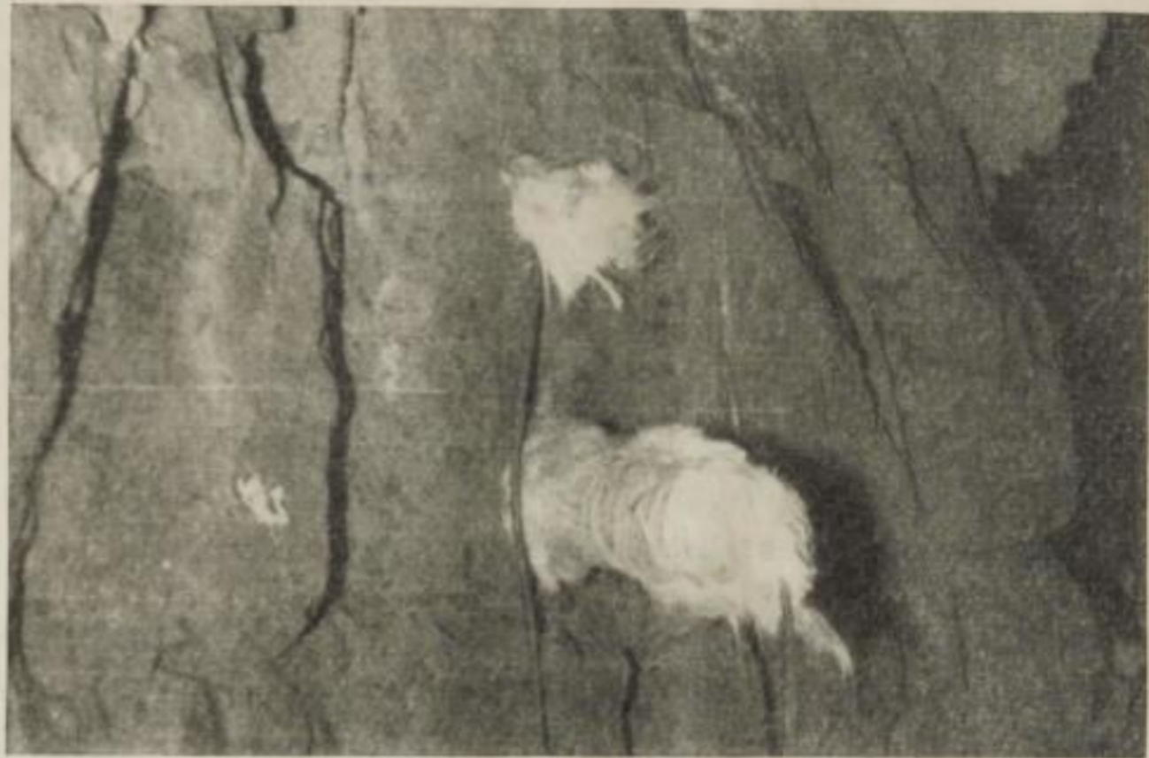
25 A b