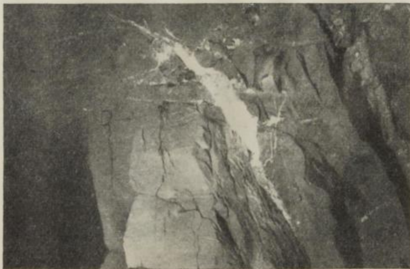
25 B a

A. An al A n W g An Ge B. Ph O Vier Net bars D M- u imp stru A es in Entf eine M enzur w wlog O Te gung gamm den wurde ungen Heiler