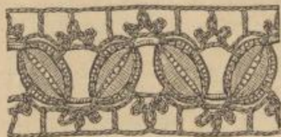
Nr. 68. Zwischensatz mit Medaillonband.

Nr. 73. Spitze. 1. Tour: 7 Luftm., 1 f. M. in die fünftfolgende Anschlagmasche, * 5 Luftm., 1 f. M. in die drittfolgende M., 13 Luftm., 8 M. übergangen, 1 f. M. in die nächste M.; vom * wiederholt. 2. Tour: * 1 f. M. in die nächste M. der vorigen Tour, 3 Luftm., 6 St. in die nächsten 6 M., 1 f. M. in die mittlere der nächsten 5 Luftm., 6 St. in die ersten 6 der nächsten 13 Luftm., 3 Luftm.; vom * wiederholt. 3. Tour: 3 Luftm., 1 f. M. in die 3. der nächsten 3 Luftm., * 13 Luftm., 13 M. übergangen, 1 f. M. in die nächste M., 5 Luftm., 5 M. übergangen, 1 f. M. in die nächste M.; vom * wiederholt. 4. Tour: 1 f. M. in die nächste M., * 6 St. in die ersten 6 der nächsten 13 Luftm., 3 Luftm., 1 f. M. in die folgende M., 3 Luftm., 6 St. in die nächsten 6 M., 1 f. M. in die mittlere der nächsten 5 Luftm.; vom * wiederholt. 5. Tour: 7 Luftm., 1 f. M. in die 1. der auf die nächsten 6 St. folgenden