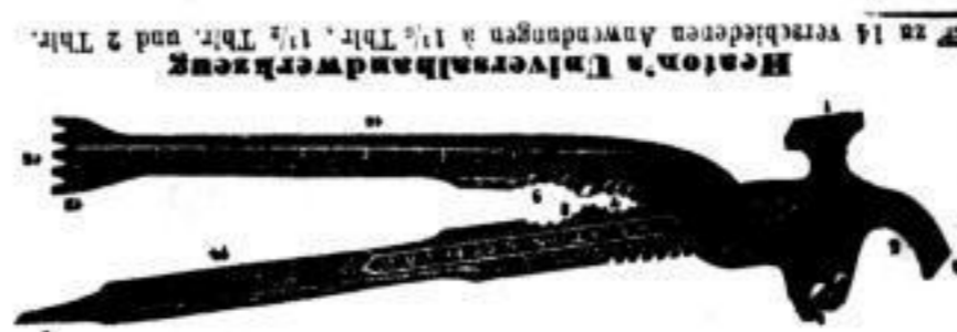
Heaton's Universalhandwerkzeug zu 14 verschiedenen Anwendungen à 1 1/2 Thlr., 1 1/2 Thlr. und 2 Thlr.

Reisedecken, Plaid's, Taschen, Koffer, Morgenschuhe, Handschuhe, Hüte und Mützen, K. Stöcke und Schirme.