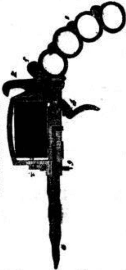
Amerikanische Patent-Handwaage, vereinigt Revoier, Dolch und Stosring, complet mit Ebnl und 50 Pausen 18 1/2 Thlr.