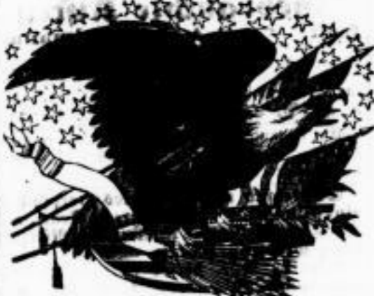
feine Küche. — Frucht-Gelbes und Frucht-Marmeladen. — Chinesische schwarze Thees und Carawanen-Thee und noch vieles Andere laut speciellem Preis-Courant.

Agentur und Depot des Hauses L. Mc Murray & Co. in Baltimore, Niederlage der Anglo-Continental Thee-Association in London, Grosses Lager von Crosse & Blackwell in London, sowie der englischen Biscuitfabrik von Huntley & Palmers in Reading und London.