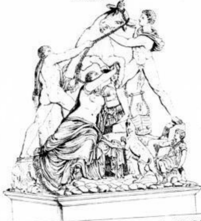
2 Bände. Mit 90 Abbildungen nach antiken Kunstwerken. Dritte Auflage. Preis für beide Bände: geheftet 7 Mk. 20 Pf., elegant gebunden 9 Mk.

Erzählungen aus der alten Welt von H. W. Stoll .