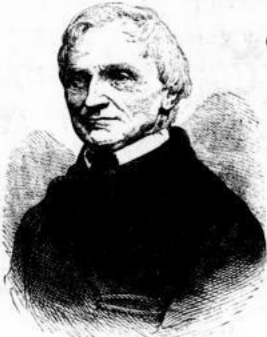
König Johann von Sachsen. geb. 12. December 1801, gest. 29. October 1873.

Metrisch übersetzt und mit kritischen und historischen Erläuterungen versehen von Philaethes (König Johann von Sachsen).