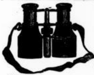
(R. B. 703.)

Operngläser von 9—100 M., Reiseperspective, Fernrohre, einfache und doppelte, von 3—130 A., Brillen, Klemmer, Vornetten, Lupen, Briefwaagen, Compasse, Barometer (Luftbarometer für Höhenmessungen), Thermometer für Kerze, Reife, Zimmer, Fenster etc., Heißzange, Mikroskope, Stereoskope, Camera obscura, Laterna magika und deren Bilder verschied. Art. Große Auswahl in goldenen und silbernen Brillen u. Klemmern. Brillen ohne Handeinfassung etc. etc. empfiehlt das optische Institut von O. H. Meder , Markt, Kaufhalle, im Durchgang, Gewölbe 27.