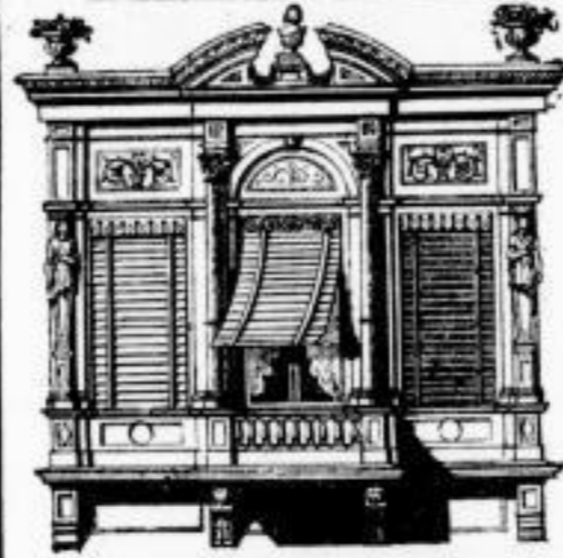
Bayer & Oberpaur in Esslingen, Württemberg.

Rosen hochstämmige, frühe Exemplare, in Töpfen gut durchwurzelt, mit Blüthen und Knospen, feine Sorten, bergl. wurzeln in feinem Government empfiehlt lebhaft, Befellungen werden auch während der Feiertage angenommen. F. A. Spilke, Petersstr. Nr. 41, gegenüber's Hof u. Neumarkt 41, große Feuerstrasse.