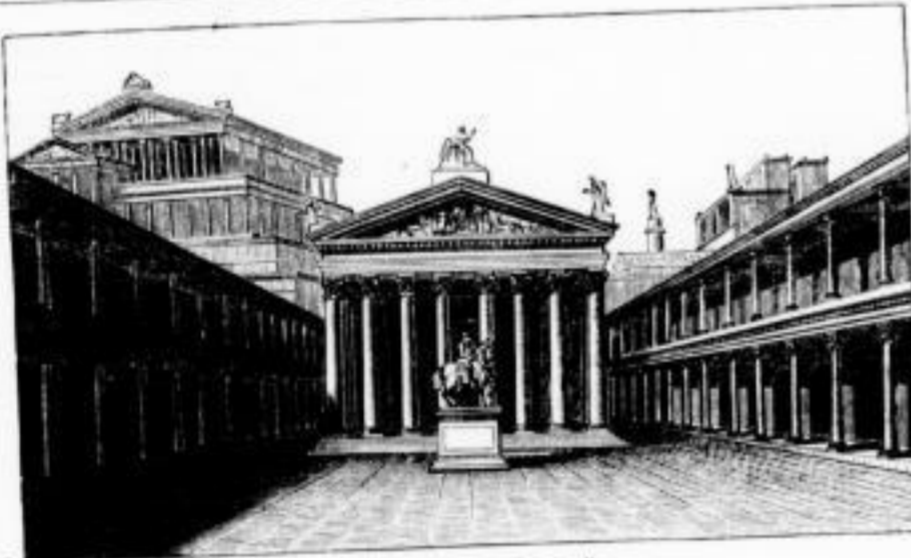
Forum des Julius Cäsar zu Rom.

Von H. W. Stoll. Mit zahlreichen Abbildungen. Zweite Auflage. 1875. 8. geb. 4 Mk. 50 Pf. Elegant gebunden 6 Mk.