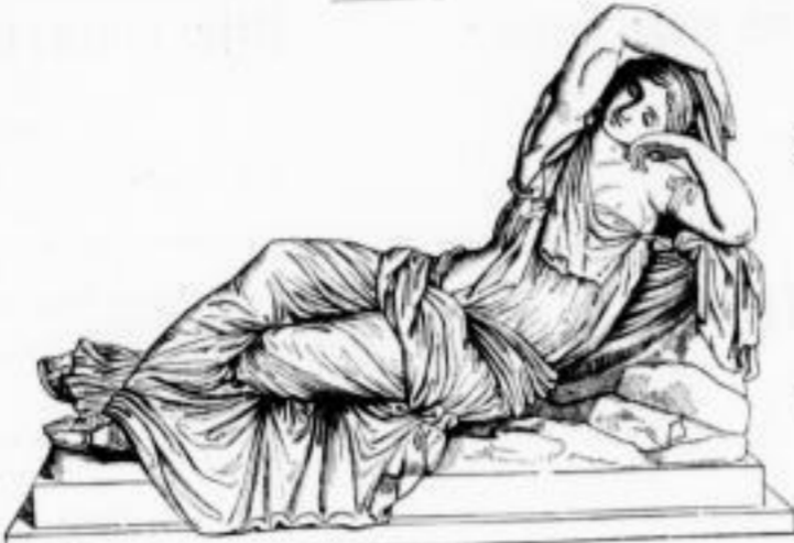
Schleier der Ariadne.

des classischen Alterthums. Popularer Mythologie der Griechen und Römer von H. W. Stoll. Fünfte Auflage. I. Band: Die Götter. II. Band: Die Heroen. Mit 42 Abbildungen nach antiken Kunstwerken. Preis für beide Bände: geb. 4 Mk. 50 Pf., eleg. geb. 6 Mk.