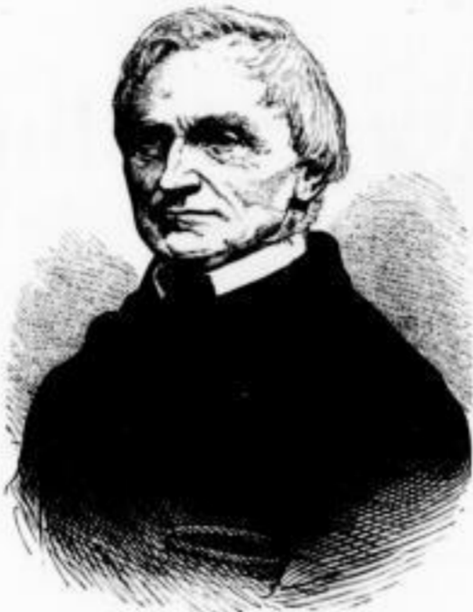
König Johann von Sachsen.

VON PHILALETHES (König Johann von Sachsen).