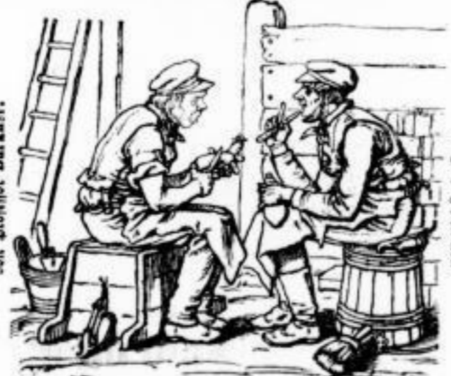
(*) „Die Meier-Weidener“, als Illustrationsprobe. (* Dieses Geschichtchen, welches in der 2. und 3. Auflage der 1. Reihe weg gelassen wurde, ist hier auf mehrfältig gedruckten Wunsch wieder mit aufgenommen worden.) Preis 1 A 50 G., fein geb. 2 A 25 G.