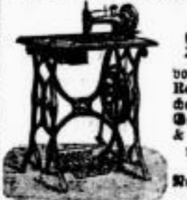
Neue... Neue... Neue...