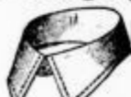
CASPIAN Einfache Steppnaht. Das Dutzend 70 Pfgs.

Mey's Stoffwäsche ist der leinenen Wäsche schon deshalb vorzuziehen, weil sie nicht gewaschen und gepültet zu werden braucht. Da Mey's Stoffwäsche mit einem leinenartig appetitlichen Webstoff vollständig überzogen ist, nur in den best passenden Façons hergestellt wird, dabei kaum den Preis des Waschlohn leinener oder baumwollener Kragen und Manschetten kostet, so können wir Jedermann nur raten, einen Versuch zu machen. Jeder einzelne Kragen kann fast eine ganze Woche getragen werden, ohne unsauber zu werden. Weniger als 1 Dutzend per Façon wird nicht abgegeben.