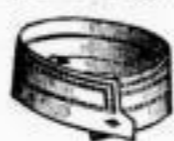
FRANKLIN Double Steppnaht. Das Dutzend 55 Pfgs.