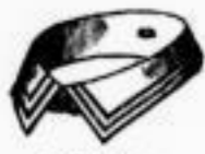
GLORIA A. Double Steppnaht. Das Dutzend 55 Pfgs.

aus der Fabrik von MEY & EDLICH, Plagwitz-Leipzig.