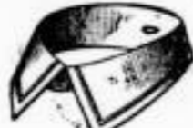
STAR Schwarznaht. Das Dutzend 65 Pfgs.