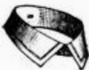
LINCOLN Einfache Steppnaht. Das Dutzend 60 Pfgs.