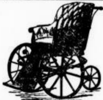
Krankwagen der verschiedensten Art.

Kinder-Wagen. Kinder-Wiegen. Kinder-Betten. Kinder-Stühle. Kinder-Tische. Kinder-Schreibpulte. Kinder-Schlitten. Kinder-Velocipèdes. Spielwaaren.