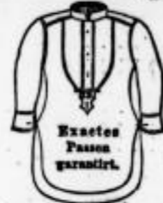
Exactes Passen garantirt.