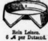
Rein Leinen. 6 A per Dutzend.