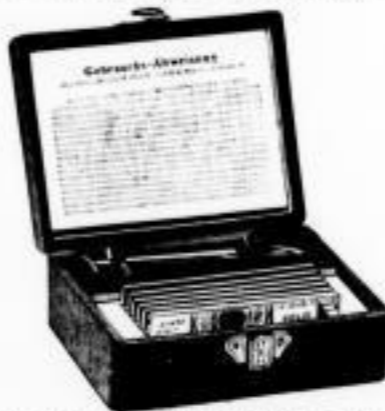
1/2 natürl. Grösse. Complet 6 Mark.

(siehe Abbildung) zu dem enorm billigen Preise von 6 Mark. Dasselbe ist mit den besten Hilfswerkzeugen ausgerüstet. Man findet in dem geschmackvoll arrangirten Kästchen, im kleinsten Raum vereinigt, ein stellbares Mikroskop mit 50 Mal Linear- = 2500 Flächen-Vergrösserung, das auch zu Trichinen-Untersuchungen verwendet werden kann, eine vortreffliche Lupe mit 6 facher Vergrösserung, eine Anzahl fertiger Präparate, sowie die Vorrichtung nicht nur zur Herstellung von Präparaten, sondern auch zur Untersuchung und Betrachtung lebender kleinster Thiere und Pflanzen. Das Instrument hat sich in Schule und Haus bereits sehr gut eingebürgert und reicht überall da vollkommen aus, wo es nicht auf streng wissenschaftliches mikroskopisches Stadium ankommt.