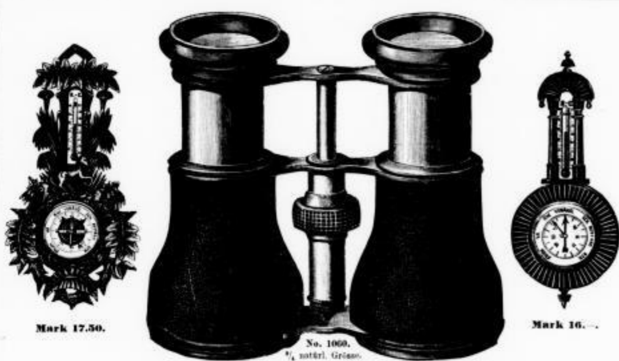
Fig. No. 4. Mark 17.50.

1000 950 900 850 800 750 700 650 600 550 500 450 400 350 300 250 200 150 100 50 0