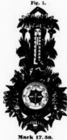
Mark 17. 50.