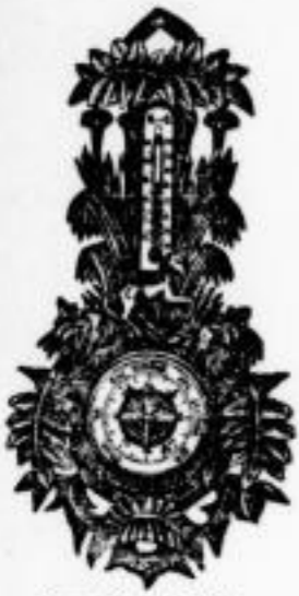
Garantirt gutes Werk, Mark 17.50.