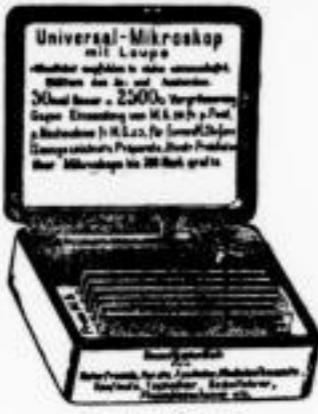
( \frac{1}{2} natürl. Größe.) Complet: 6 Mark.