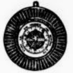
Garantirt gutes Werk, Mark 11.50.