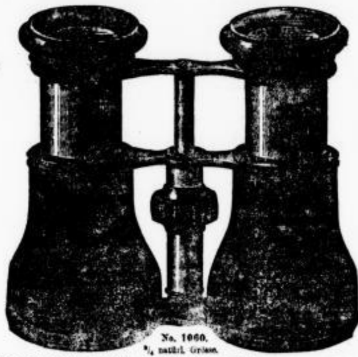
No. 1060, \frac{1}{2} natürl. Größe.