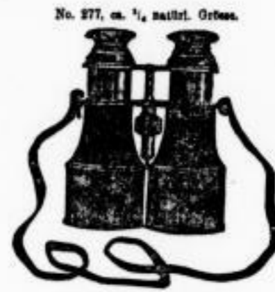
Krimmstecher Mark 15.50.