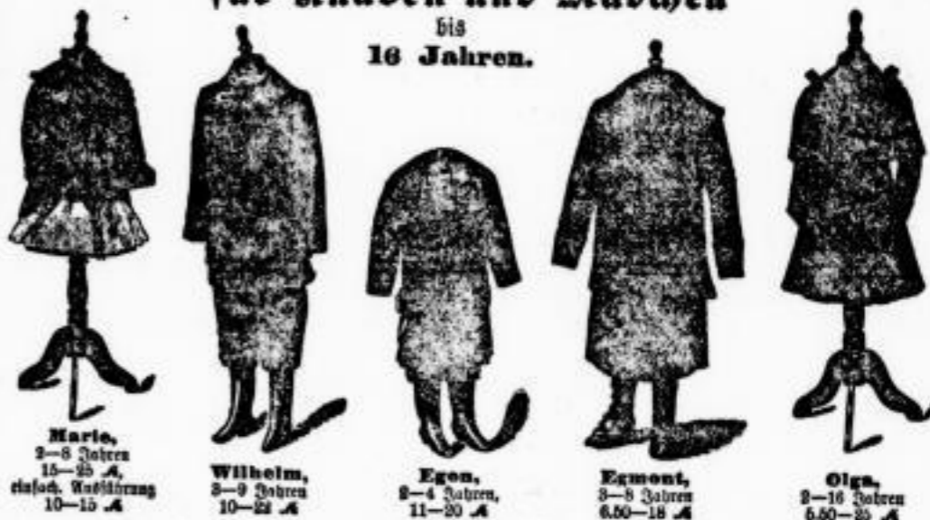
Marie, 2-8 Jahre, 15-25 A, elast. Knöchelung 10-15 A