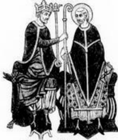
Illustration eines deutschen Königs im 12. Jhd.

Das obere Bild zeigt einen Teil des Reichs, X. Jhd. in der Bibliothek in 21. C. 18.