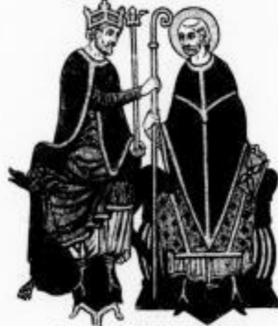
Wiederherstellung des Bildes nach dem Original