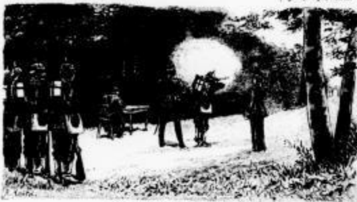
Wache bei Köthungen. Bei der Scherke.

Die Verlagshandlung hat Wert darauf gesetzt, dasselbe in bestimmten Grenzen zu halten, sowohl des Formates als des Preises. So ist es leibar und erschwinglich geblieben. Dabei ist die Ausstattung eine sehr sorgfältige; Holzschnitte wie diese sind in Deutschland nicht viel gedruckt worden.