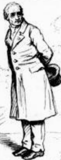
Wiederherstellung des Bildes nach dem Original von Thiersch

welche in gediegenen Einbänden in allen Buchhandlungen zu haben sind.