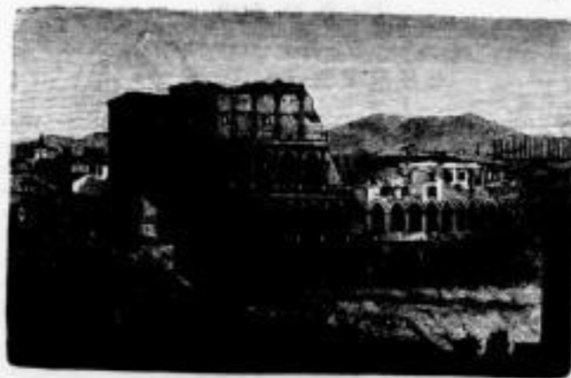
Kapitolium bei Herculaneum

Sechste verbesserte Auflage, von Prof. Dr. Max Erix. Mit zahlreichen Abbildungen. 24. 8. Preis gebunden 12 Mk., elegant gebunden 14 Mk.