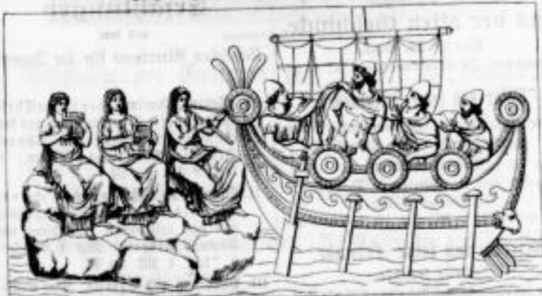
Odysseus und die Sirenen.