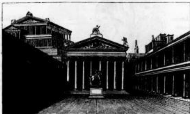
Heraus von Julius Keller in Wien.

Mit zahlreichen Abbildungen. 2. Auflage. 8. geh. 5 M. 70 Pf.; eleg. geb. 7 M. 20 Pf.