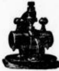
Transmissionen nach Patent Lorenz.

tach bewährten Systemen. Der mit den vollkommensten modernen Hilfsmitteln ausgerüstete Neubau unseres gesamten Etablissements setzt uns in den Stand, selbst die schwierigsten Aufträge in kürzester Zeit zu erledigen.