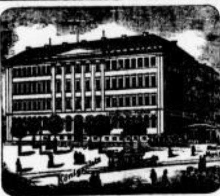
Größtes Spezialgeschäft Deutschlands.

Centralgesch. Leipzig: Reichenstr. 6. Grenz bei Schlegel.