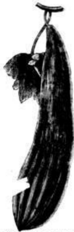
Nr. 289. Schlangen-Erbsen. 1 Kilo . \mathcal{M} 10,— 20 Gr. „ 0,40.