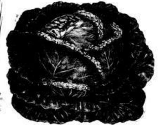
Nr. 21. Wirsing, Uimer, niedriger krauser. 1 Kilo . \mathcal{M} 6,— 20 Gr. „ 0,20.

Führe und liefere alle auch nicht hier aufzeichneten und abgebildeten Sorten, offerire für kleinere Gärten auch in 5 \mathcal{M} - und 10 \mathcal{M} -Portionen: Petersilie, Pfefferkraut, Dille, Fenchel, Majoran, Spinat, Porree, Basilicum, Portulak, Thymian, Mangold, Carotten, Möhren, Pastinak, Sellerie, Krauskohl, Rosenkohl, Blumenkohl, Herbstrüben, rothe Rüben, Kerbelrüben, Mairüben, Zuckerrüben, alle Salat-Arten, Kresse, Rapunzel, Mairrettig, Sommerrettig, Herbstrettig, Winterrettig, Melonen, Kürbisse, Erbsen und Bohnen in 70 Sorten etc. etc.