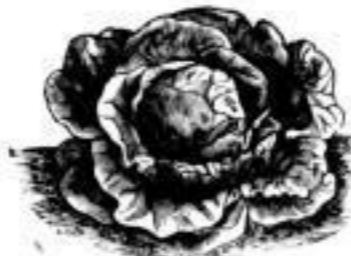
(Neuheit.) Salat Rudolph's Liebling. Salat Rudolph's Liebling , unter- scheidet sich von andern Salaten durch die auffallend leuchtend citrongelbe Farbe, ist eine späte, aber lang aus- dauernde und gegen die Hitze wider- standsfähige Sorte. Salat Rudolph's Liebling ist zwar schon einige Jahre im Handel, verdient aber seiner Vor- züge halber ganz besonders hervor- gehoben zu werden, 90 Gr. 60 \mathcal{M} .