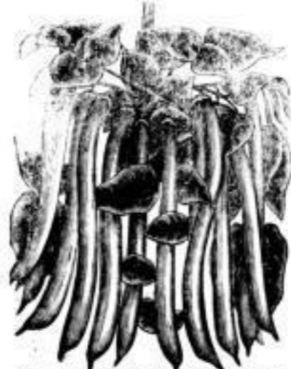
Nr. 390. Buschbohnen, Flageolet-Wachs- mit gelben Schoten. 100 Kilo . \mathcal{M} 60,— 1 „ „ 0,70, 100 Gr. „ 0,10.