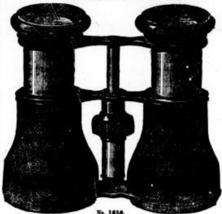
No. 1456. Doppelstecher für Reise und Theater. Preis: 10 Mark 50 Pf. Incl. Leder-Etui und -Riemen zum Umhängen.

Rein achromatisch, 6 Linsen. Preiswertheestes Instrument für 1888.