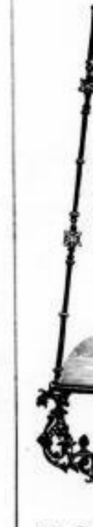
114. ff. mit Zug, 14" Patentbrenner