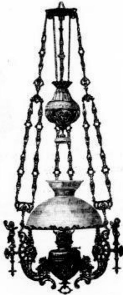
125. hochff. bronc. reichverzierte Hängelampe mit Zug, Schirm 45 cm. mit 30" Luftzylinder „Saxonia“ . . . M. 49.— Dieselbe mit Prismen . . . . . 55.—