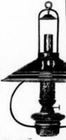
106. Drathlyra mit 28 cm Reflector und 14" Patentbrenner Dieselbe m. 48 cm. gr. Refl. und 20" Glühlichtbrenner Dieselbe m. 58 cm. Reflector mit Prismenreihen M. 1.3. Billigste und beste Fabrik