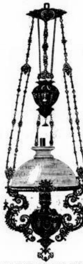
124. hochff. galvanisierter u. bronc. reichverzierte Hängelampe mit Zug, 40 cm. gr. Schirm u. 20" Glühlichtbrenner M. 39.—