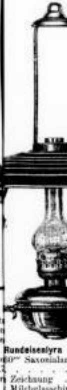
108. Saxonialampe mit Zeichnung Milchglaschirm

Reparaturen sowie Aufbronzungen an Lampen aller Art werden schnell und billig ausgeführt.