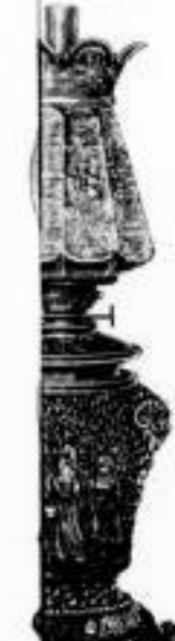
104. Majolikakörper mit Kindergruppe Metallbeschlag Patentbrenner u. ff. Kugel M. 25.—