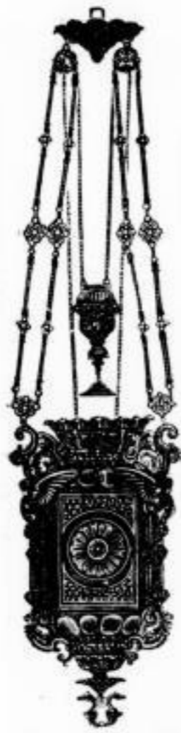
512. ff. bronzierte u. reichverzierte Glaslampe mit rosa optischem Glase incl. Lampe M. 37.50.