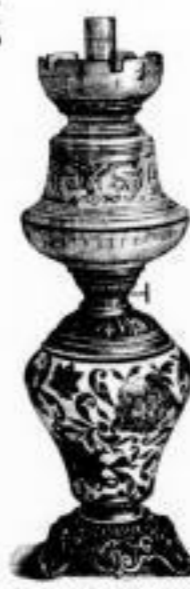
174. hochff. Majolikakörper mit galvanisierter Metallbeschlag, 14" Patentbrenner u. ff. Tulpe M. 26.50