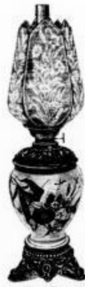
199. hochff. decor. Majolikakörper mit galvanisierter Metallbeschlag, 14" Patentbrenner u. ff. Tulpe oder Kugel M. 17.50