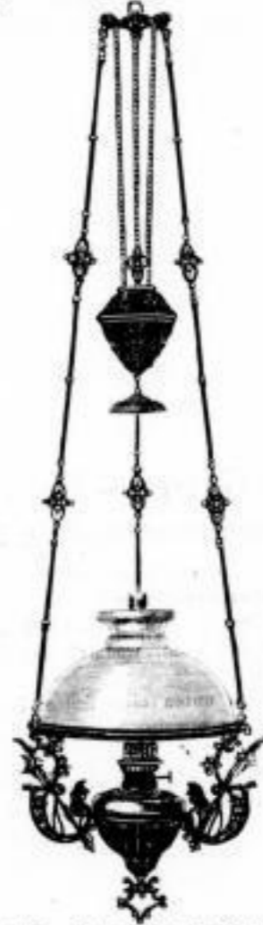
1200a. ff. bronzierte Hängelampe mit Zug, Schirm 30 cm. und 14" Patentbrenner . . . . . M. 10.50