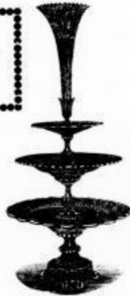
250. Tafelsetz mit ff. geschliffener Tulpe, ff. galvanisirt . . . . . M. 31.50

Bei Fabrik-, Comptoir-, Restaurations-Beleuchtungen von meinen „Saxonia-Blitzlampen“ gewähre ich bei directen Aufträgen von 50 Mark an, noch angemessenen Rabatt. Auf schriftliche Anfragen von Leipzig und Umgegend sende bereitwilligst einen sachkundigen Mann ins Haus.