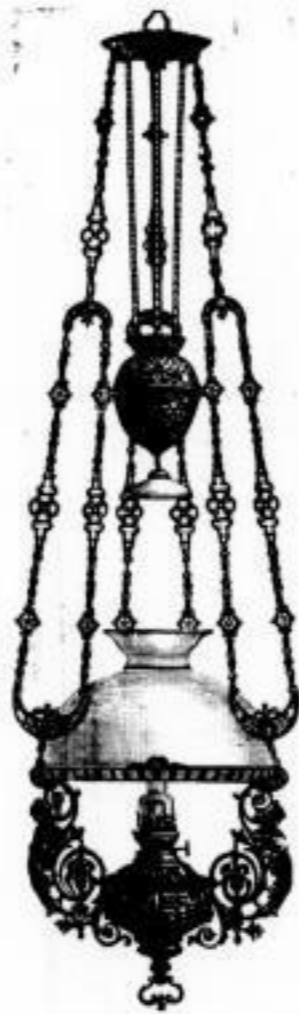
110. ff. bronc. und reichverzierte Hängelampe m. Zug, Schirm 33 cm. und 14" Patentbrenner M. 22.—