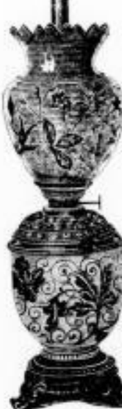
103. hochff. decor. Majolikakörper mit galvanisierter Metallbeschlag, 14" Patentbrenner u. ff. Tulpe oder Kugel M. 25.—