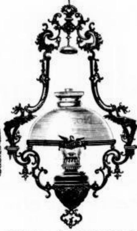
107. Gusslyra m. 40 cm. Glocke u. 20" Brenner M. 25.— Dieselbe mit 30" Saxonia-Lampe . . . . . 30.—