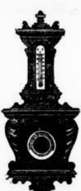
Nr. 465. Barometer mit Thermometer in Fußbaum und Eiche, hochgelegener Ausführung, Preis A 18.50.