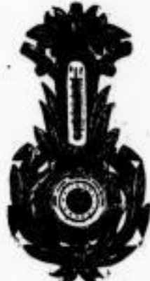
Nr. 310. Barometer mit Thermometer 40-45 cm lang, elegante Schutzhülle, garantiert gutes Werk, A 12.50.