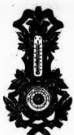
Nr. 312. Barometer mit Thermometer 40-45 cm lang, elegante Schutzhülle, garantiert gutes Werk, A 12.50.

Normal-Hemden Normal-Hosen Normal-Jacken Normal-Leibbinden Normal-Socken Normal-Strümpfe Normal-Corsetten Normal-Strickgarn Normal-Tricotstoff Dr. Meter 3 Wert. Normal-Hemdosen Grosser Lager. Billige Preise. F. B. Eulitz, Grimmaische Str. 30.