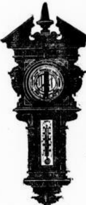
Nr. 464. Barometer mit Thermometer (siehe Text) in 4 verschiedenen Preisen, zu A 26.50 zu A 32.00 zu A 55.00 zu A 68.50.