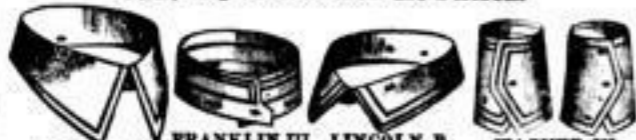
HERZOG III, Dtsd. M. 0.80. FRANKLIN III, Dtsd. M. 0.60. LINCOLN B, Dtsd. M. 0.65. WAGNER III, Dtsd.-Paar M. 1.20.

Mey's Stoffkragen sind keine Papierkragen, denn sie sind mit wirklichem Webstoff vollständig überzogen, haben also genau das Aussehen von Leinenkragen; sie erfüllen alle Anforderungen an Haltbarkeit, Billigkeit, Eleganz der Form, bequemes Sitzen und Passen.